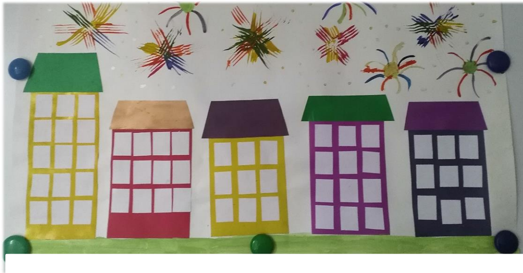
Аппликация «Улица города»